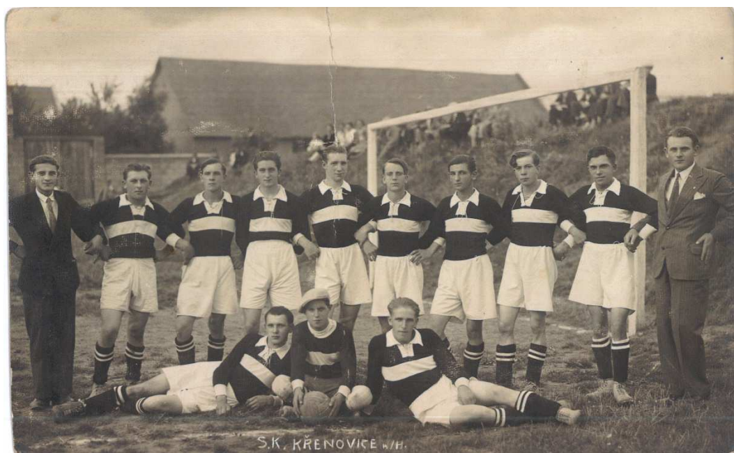
Mužstvo I (A)