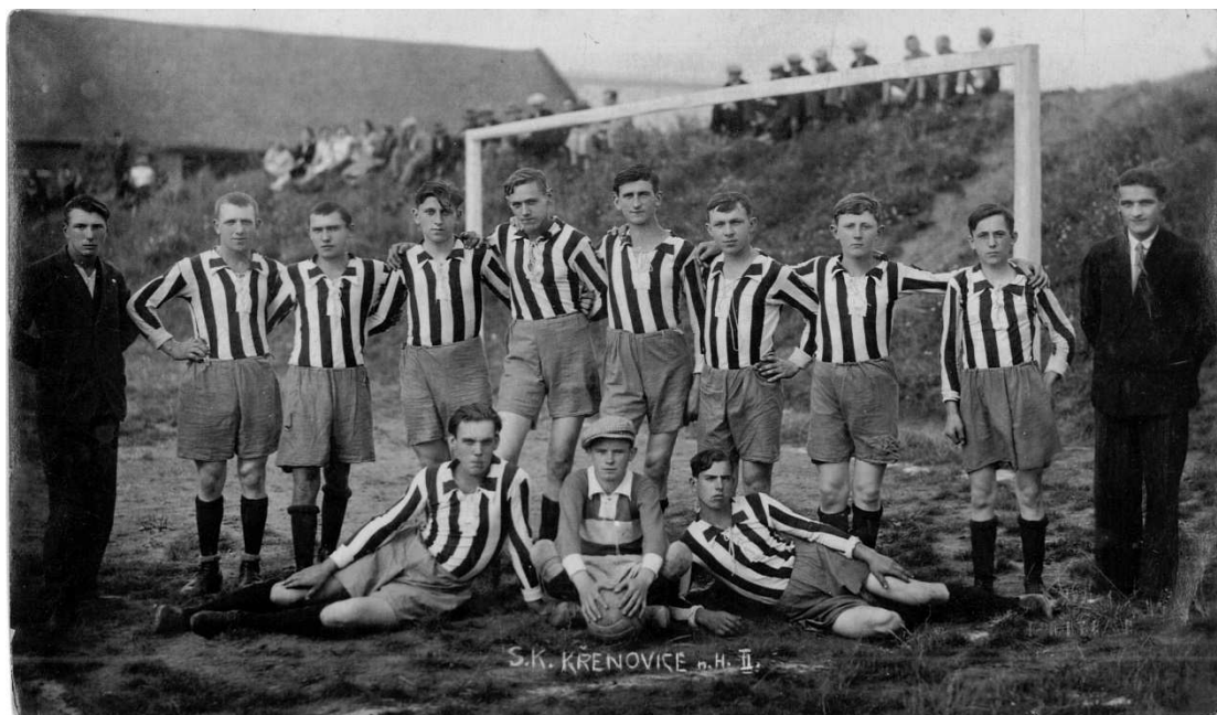
Mužstvo II (B)