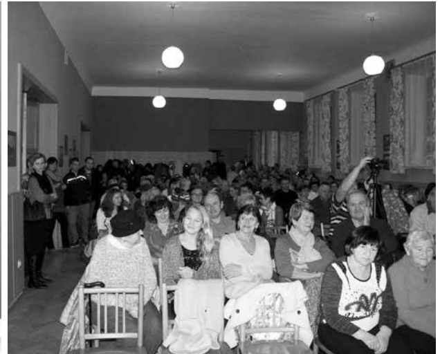
Foto z vánoční besídky