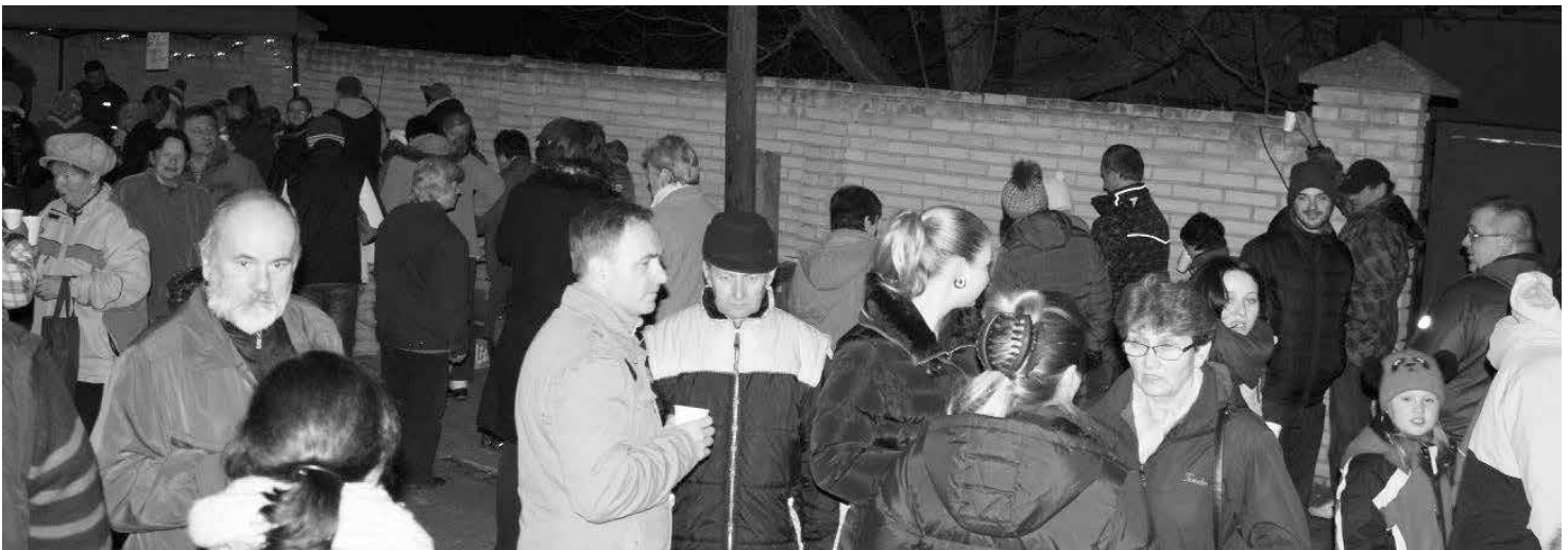
Rozsvěcení vánočního stromčku